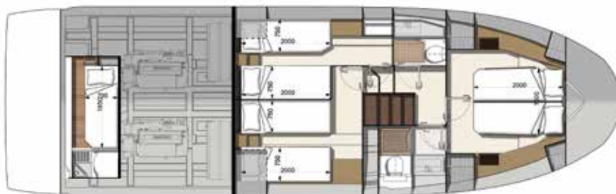
Model available with 2 or 3 staterooms