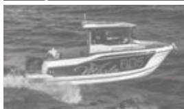
Merry Fisher 695 marlin